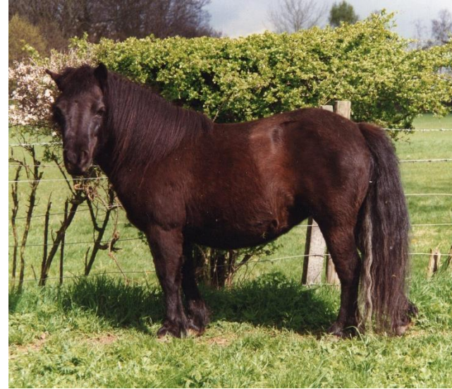
Trix of Drakelaw – Sophie of Drakelaw's søster