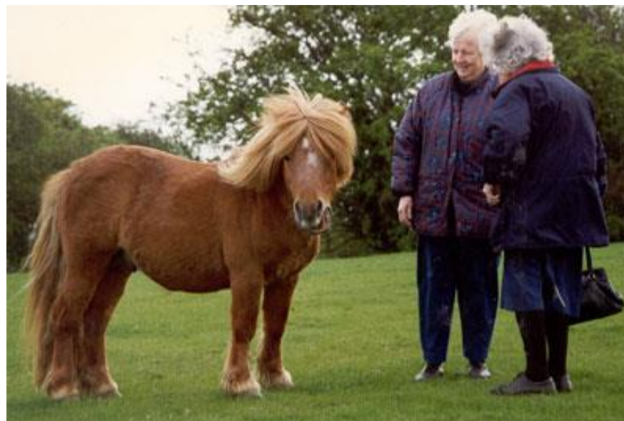
Goldcrest of Drakelaw blev i 2002 udtaget til at deltage ved "The Veteran Horse Society Grand Final" på Olympia i London - dette er den største ære en pony/hest kan få.