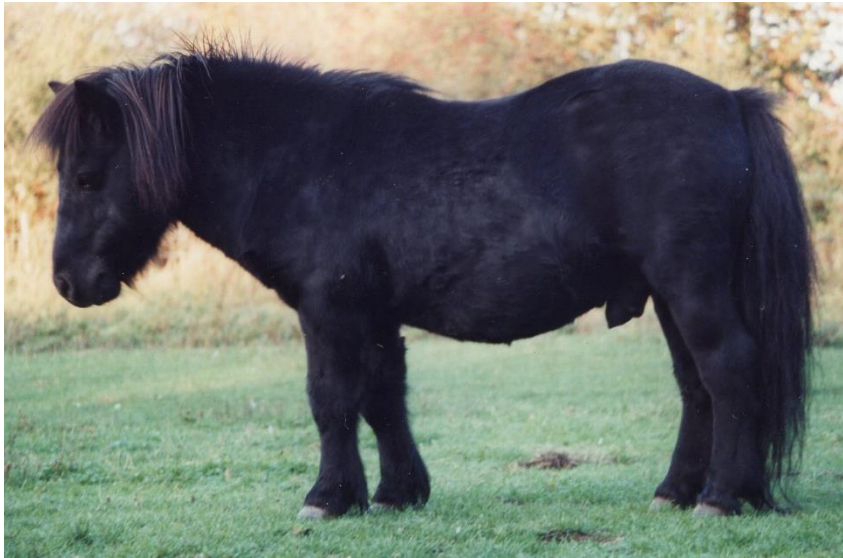
Val of Drakelaw