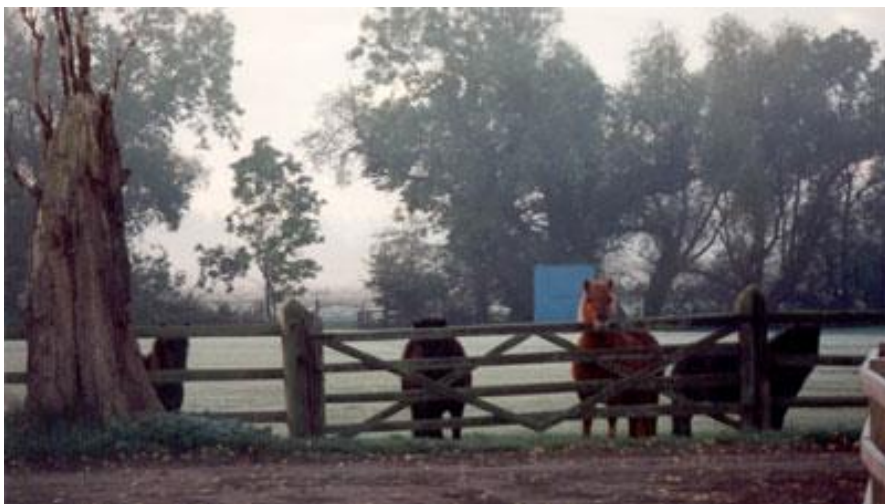
Mit første møde med Sophie of Drakelaw