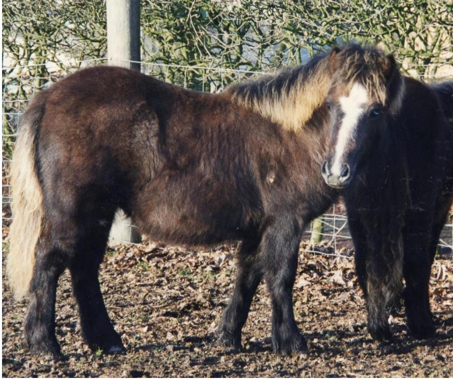
Candy of Drakelaw