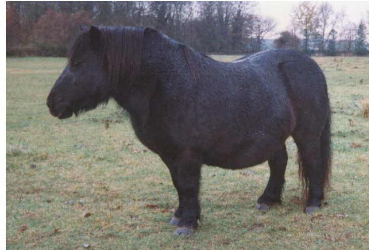
Blue Bounting of Drakelaw