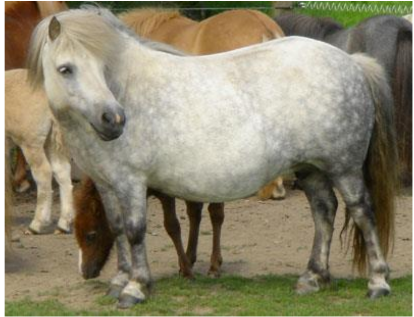
Candy of Drakelaw