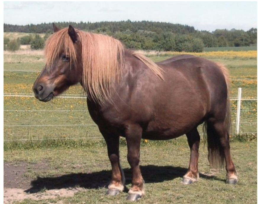
Sophie of Drakelaw