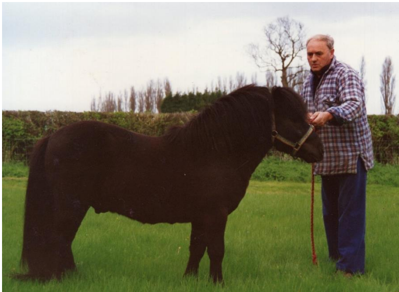
Mint of Drakelaw