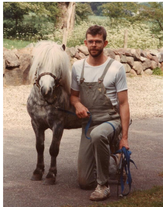
Gillinto of Drakelaw