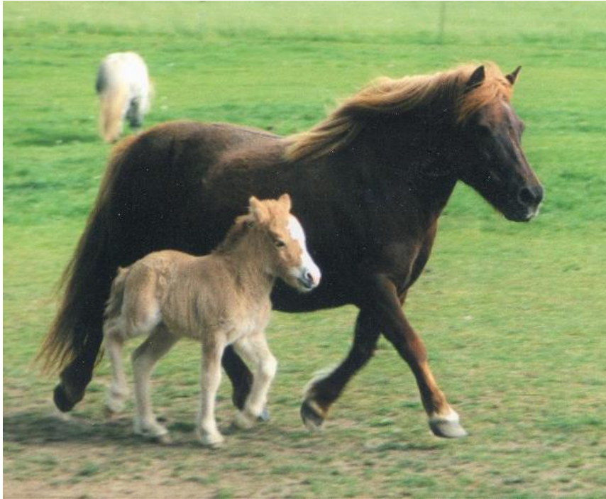
Sophie of Drakelaw med Abildores Kenzo