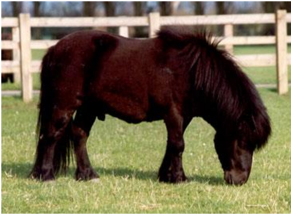
Mint of Drakelaw