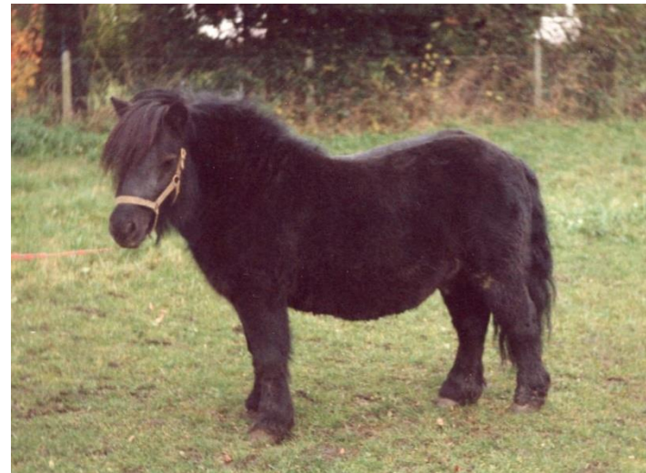
Minto of Drakelaw