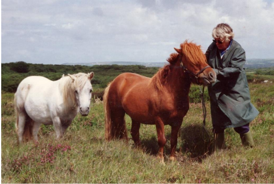
Southley Hurrigan Higgens & Little Stoke Second Pearl