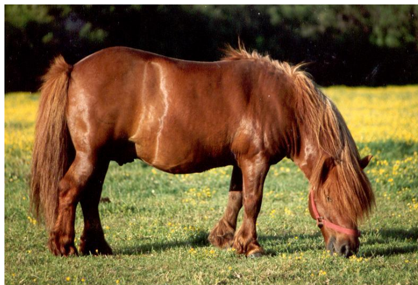
Prancer of Methven