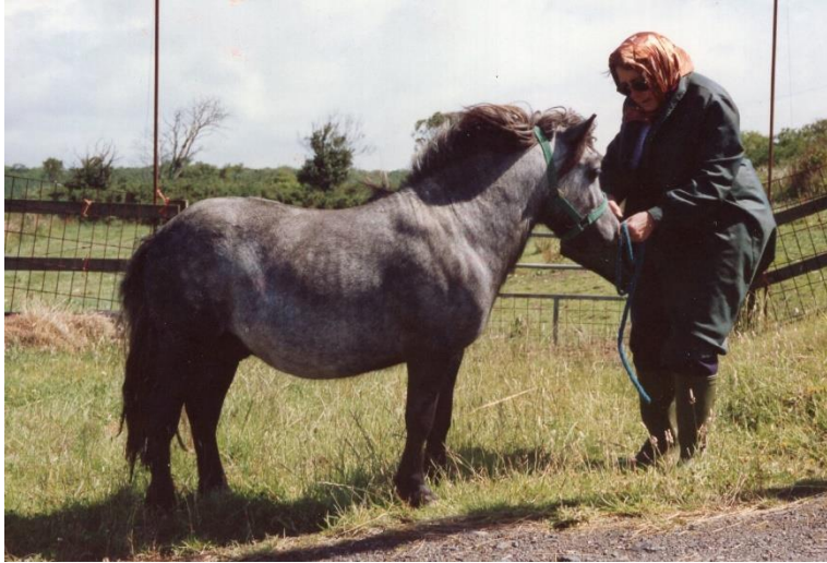
Southley Cousin Jack