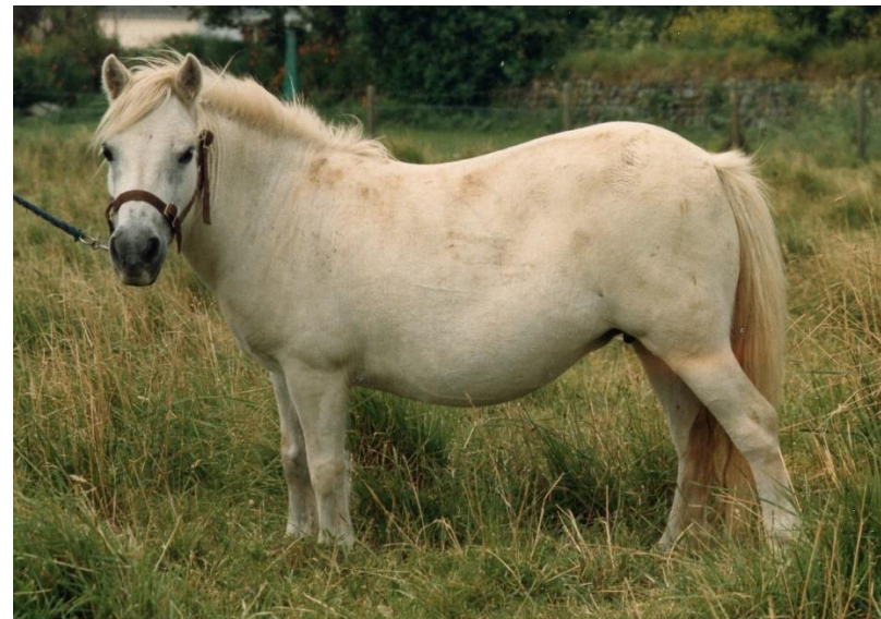
Southley Lavender Blue