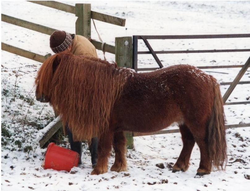
Southley Hurrigan Higgins