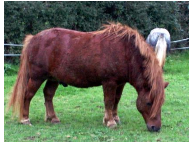
Ulverscroft Harvest Moon