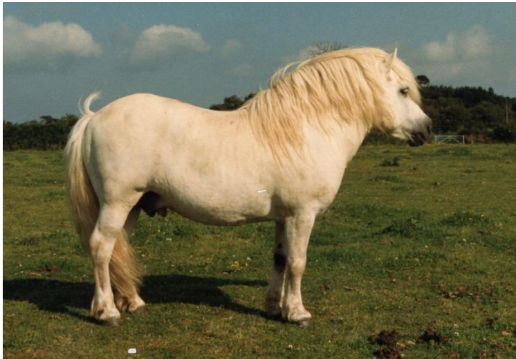
Southley Silver Prince