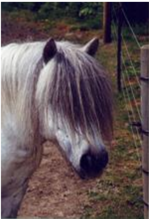
Southley Bilberry Southly Mignonette / Prancer of Methven

Southley Bilberry ankommer til Stutteri Abildore