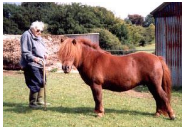
Southley Little Gem